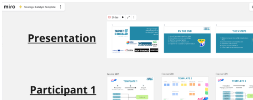
Mynd 1. Sameiginlegt stafrænt vinnusvæði sem ráðgjafar og þátttakendur nýta til að setja fram stefnu á myndrænan hátt, skipuleggja staðfestingarverkefni og móta innleiðingaráætlanir.

Þegar þú hefur stofnað aðgang á Miro skaltu smella á þrjá punktana efst í vinstra horni, vinstra megin við „Strategic Clarity Template“. Veldu síðan Board og þar á eftir Duplicate til að búa til afrit sem þú getur breytt í þínum eigin aðgangi.