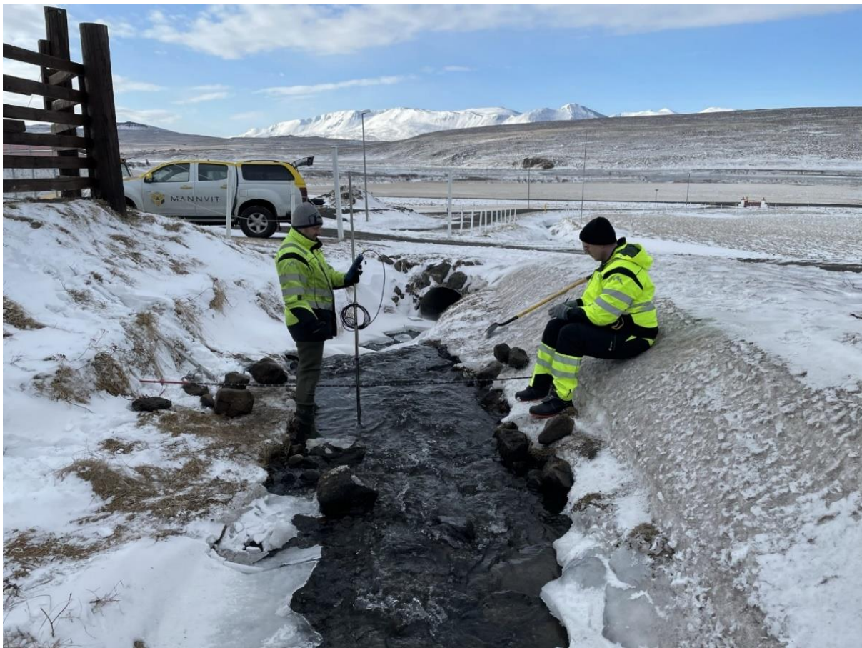
Mynd 2. Mælistaður í Skarðslæk

Þann 9. apríl 2021 var virkjunarsvæðið skoðað. Rennsli var mælt í læknum við bæjarhlaðið. Á mynd 2 má sjá mælistað Skarðslæk þar sem rennslið mældist 32 l/s. Afrennsli skv. mælingunni var meira en mátti búast við. Nokkrar ástæður geta legið fyrir því en sú helsta er að mælingin var gerð nokkrum dögum eftir úrkomu. Líklegt er að lágrennslið sé í kringum 8 l/s/km 2 , en mælt afrennsli var um 180% meira en það sem búast má við. Því var ákveðið að hafa miða virkjað rennsli við mælt afrennsli. Tafla 1 sýnir nánari niðurstöður úr mælingum og helstu kennistærðir virkjunar.