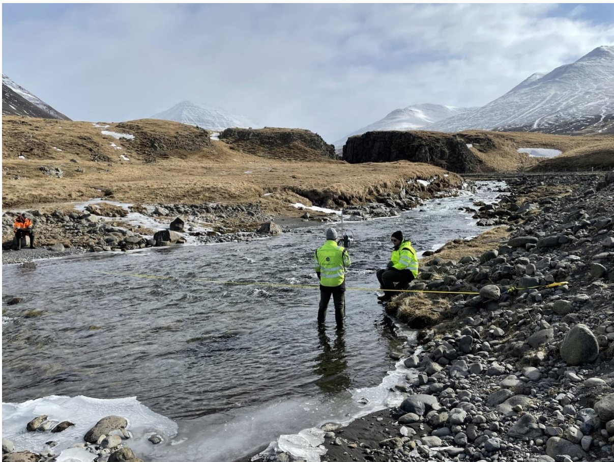
Mynd 2. Mælistaður í Djúpadalsá.

Þann 9. apríl 2021 var virkjunarsvæðið skoðað. Rennsli í Djúpadalsá var mælt 300 metrum suðvestan við samnefndan bæ. Á mynd 2 má sjá mælistaðinn þar sem rennslið mældist um 1440 l/s. Reiknað afrennsli samkvæmt mælingunni var meira en mátti búast við, líklega vegna úrkomu nokkrum dögum fyrir mælingu. Oft er lágafrennslið í kringum 8 l/s/km 2 en mælt afrennsli var um tvisvar sinnum meira en það. Því var ákveðið að miða virkjað rennsli við mælt afrennsli í stað þess að tvöfalda það eins og gert er venjulega. Tafla 1 sýnir nánar niðurstöður úr mælingum ásamt helstu kennistærðir virkjunar.