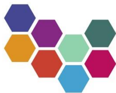
SÓKNARÁÆTLUN NORÐURLANDS VESTRA