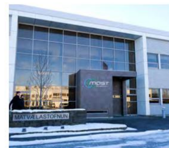
Aðalskrifstofa Matvælastofnunar er á Selfossi.

Í greinargerðinni segir einnig að um árábil hafi eftirlit með matvælum verið til skoðunar en ítrekaðar athugasemdir veruð gerðar af hálfu Eftirlitsstofnunar EFTA (ESA) frá árinu 2010 við annmarka á skipulagi