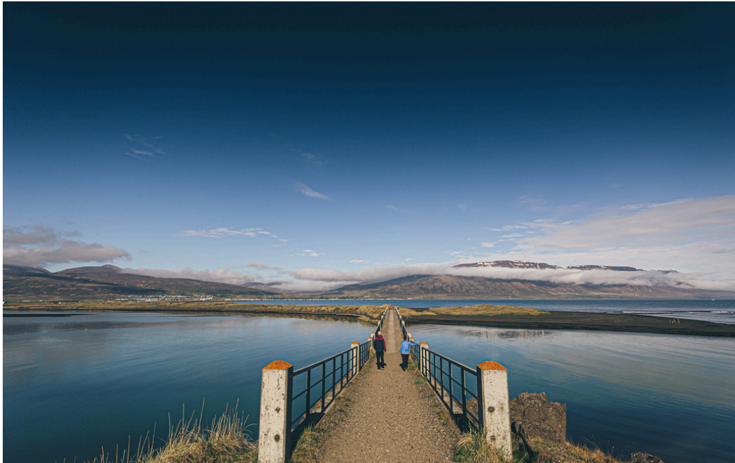
Brúin yfir Héraðsvatnaósinn, Skagafirði.

Að baki er viðburðaríkt og ánægjulegt ár í starfi Samtaka sveitarfélaga á Norðurlandi vestra þar sem unnið hefur verið að fjölmörgum verkefnum sem miða að því að efla samfélag og atvinnulíf í landshlutanum.