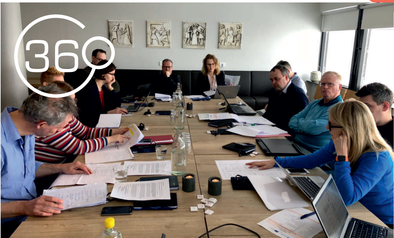
Frá öðrum samráðsfundi samstarfsaðila í verkefninu Digi2Market á Hótel Laugarbakka í apríl 2019.