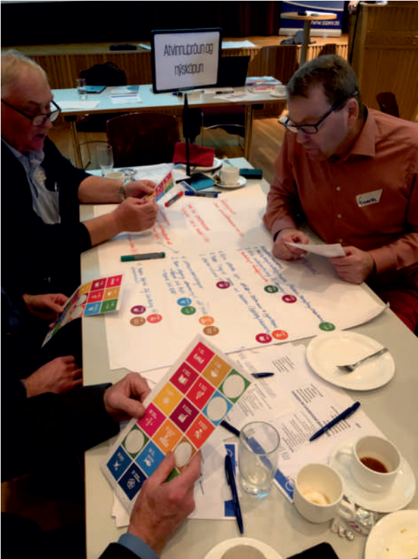
Frá íbúafundi í tengslum við gerð sóknaráætlunar í Miðgarði í september 2019.