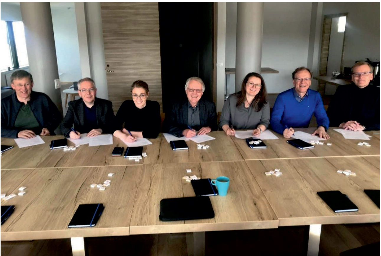
Frá undirritun viðaukasamninga við Sóknaráætlunir með vísan í lið C-1 á byggðaáætlun á Hótel Laugarbakka í júní 2019.

Nú eru því tvö verkefni á Norðurlandi vestra sem hafa notið stuðnings í gegnum þennan lið byggðaáætlunarinnar.