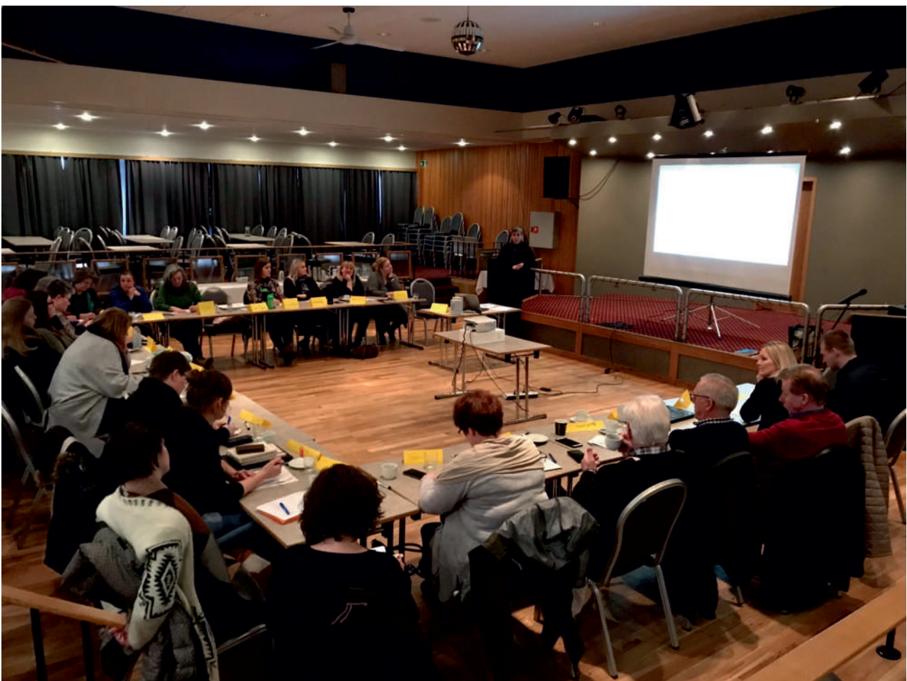
Þátttakendur í námskeiði í skipulagningu og utanumhaldi viðburða í Félagsheimilinu á Blönduósi.

Undanfarin ár hefur þjónusta atvinnuráðgjafa beinst aðallega að verkefnum tengdum ferðamálum og veitingaþjónustu eða um 50% fyrir 2019.