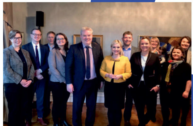
Fulltrúar landshlutasamtaka ásamt ráðherra samgöngu- og sveitarstjórnarmála og ráðherra mennta- og menningarmála við undirritun nýrra sóknaráætlanasamninga í ráðherrabústaðnum í nóvember 2019.

Sóknaráætlanir landshluta eru stefnumótandi áætlanir sem taka til starfssvæða landshlutasamtaka sveitarfélaga. Í þeim koma fram stöðumat viðkomandi landshluta, framtíðarsýn, markmið og aðgerðir til að ná þeim markmiðum. Í sóknaráætlunum landshluta er mælt fyrir um svæðisbundnar áherslur sem taka mið af meginmarkmiðum byggðaáætlunar, landsskipulagsstefnu, skipulagsáætlunum, menningarstefnu og, eftir atvikum, annarri opinberri stefnumótun.