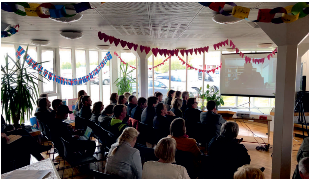
Frá ráðstefnu um umhverfismál á Húnavöllum 28. maí 2019.