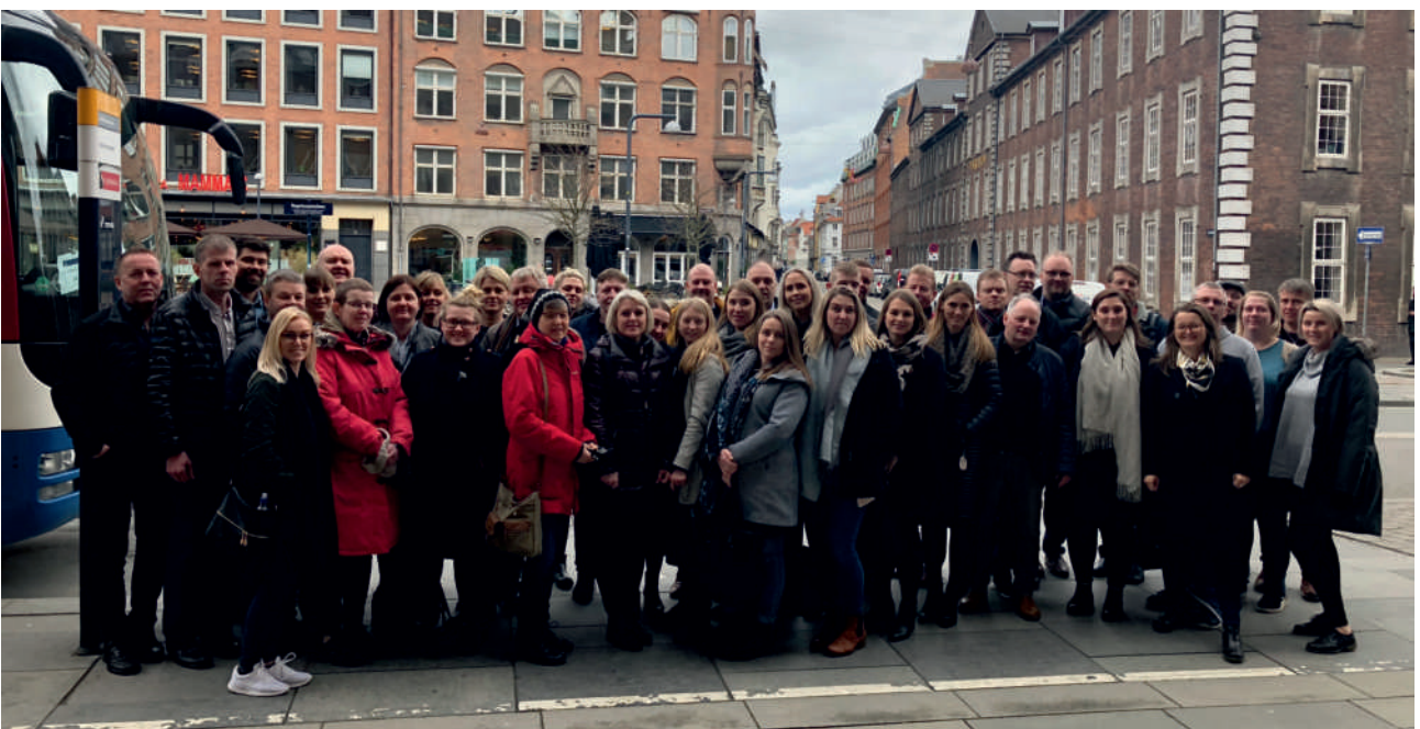
Hópurinn við lok ferðar í Kaupmannahöfn.

Allt í allt var þetta vel lukkuð ferð sem gaf þátttakendum ýmislegt til að hugsa um og máta við „sinn heimavöll“.